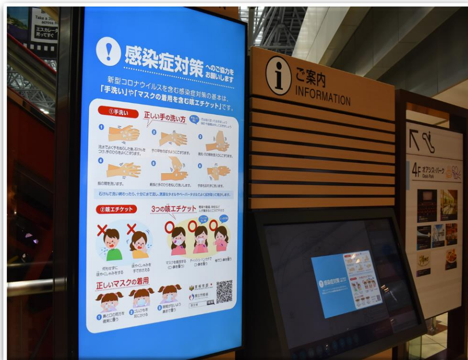
デジタルサイネージ等で感染症対策をご案内しています