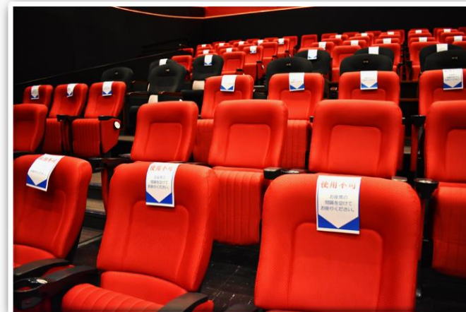
新千歳空港シアター