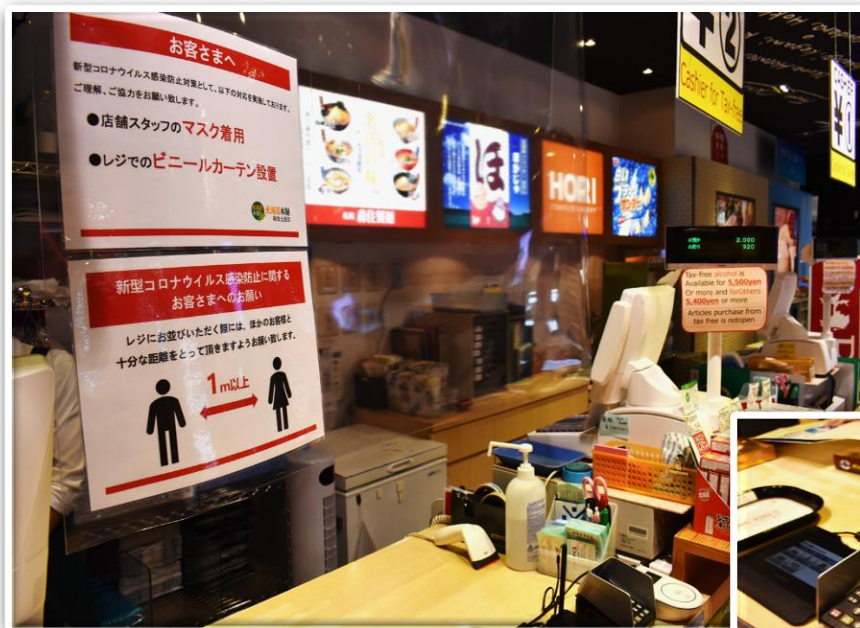
(写真は店舗の対応)