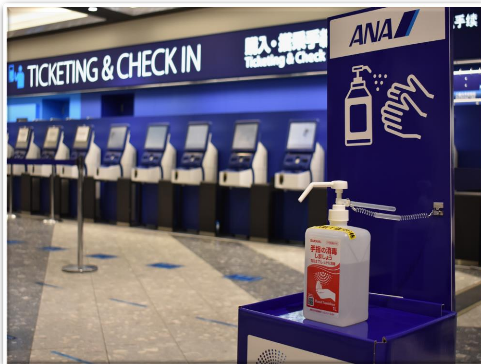
航空会社カウンター、店舗、化粧室などに消毒液を設置しています(写真は航空会社の対応)