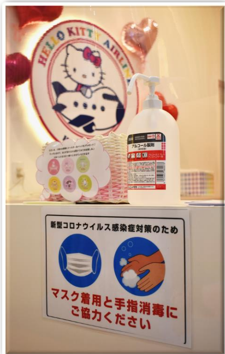
ハローキティ ハッピーフライト

©1976, 2020 SANRIO CO., LTD. APPROVAL NO. SP610031