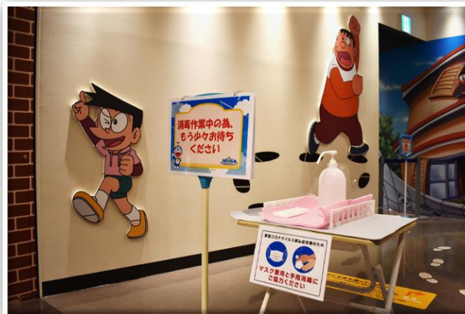
ドラえもん わくわくスカイパーク

©1976, 2020 SANRIO CO., LTD. APPROVAL NO. SP610031