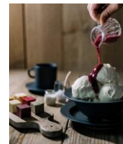
とよとみバタージェラート(川島旅館)